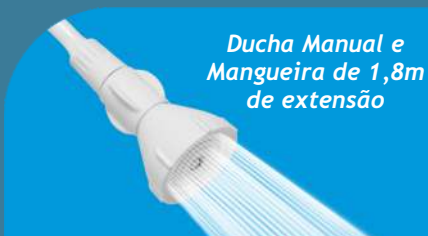
Ducha Manual e Mangueira de 1,8m de extensão

Perfeita para um banho envolvente e agradável reunindo sofisticação, elegância e toda a experiência da marca FAME em oferecer um produto de qualidade. Possui controle eletrônico de temperatura com haste removível que facilita o acesso, na hora de selecionar a melhor temperatura para o seu banho.