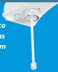
Controle eletrônico Multitemperaturas com haste de 16cm removível.